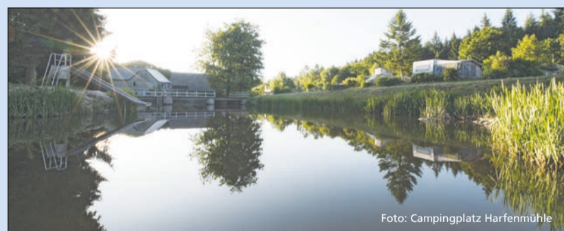
Idylle pur am See auf dem Campingplatz Harfenmühle

Wanderer können in der Region ab sofort einen einzigartigen Service in Anspruch nehmen: Der Campingplatz Harfenmühle beherbergt das neue Best of Wandern-Testcenter, in dem alle Gäste, die in der Region Urlaub machen, moderne und funktionale Wanderausrüstung für