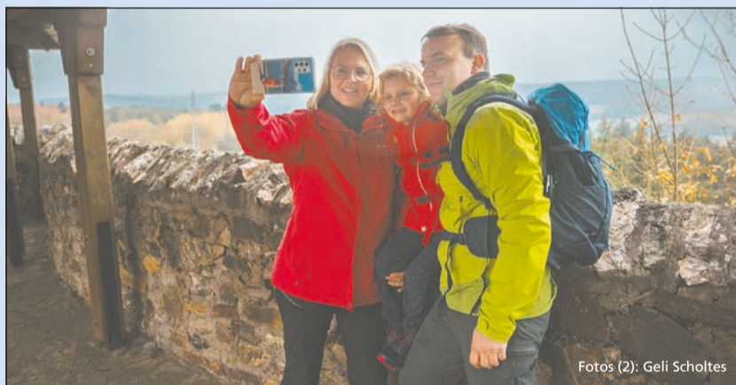
Hingucker: die Nationalparkregion Hunsrück-Hochwald

Überall säumt Moos den Wegesrand, schmale Pfade führen über Wurzeln und Felsblöcke, vorbei an glucksenden Waldbächen hinauf auf die Berge. Frisch und würzig ist die Luft der Wäl-