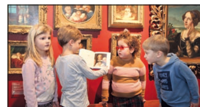
Die Kinder freuen sich über das neue Buch. Foto: Thomas

waschen“ mit Arbeiten aus dem Museum Begas-Haus in Heinsberg abgebildet werden.