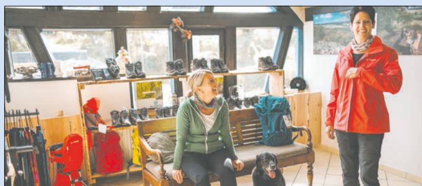
Testcenter für Wanderer: Moderne Ausrüstung kostenfrei ausleihen.

Die Lebenshilfe Journal-Redaktion gratuliert den Gewinnerinnen sehr herzlich. Die Gutscheine werden per Post oder E-Mail zugestellt. Zu diesem Zweck werden die Adressdaten einmalig dem Hotel/der Region/der Lebenshilfe Detmold zum Versand übermittelt.