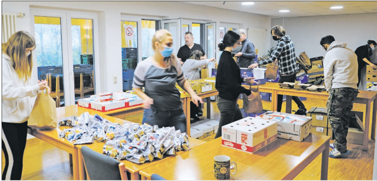
Gemeinsam mit anpacken: 1300 Martinstütten für Kinder aus Bad Münstereifel

Doch auch an diesem tragischen Ereignis hat sich wieder einmal gezeigt, dass die Lebenshilfen füreinander einstecken. Denn unmittelbar nach der Flut im Sommer bis in die zurückliegende Weihnachtszeit hinein unterstützen Lebenshilfe-Organisationen die betroffene Wohnstätte in Sinzig. „Die Hochwasserkatastrophe hat uns alle zutiefst erschüttert und