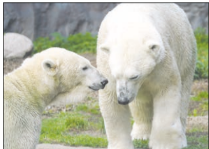
Die Eisbären im Zoo schaffen es, den Corona-Alltag vergessen zu lassen

Mit der Hilfe des Jugendrings Gelsenkirchen und dem Projekt „Aufholen nach Corona“ ging es für die Teilnehmer kostenfrei in die Gelsenkirchener Zoom Erlebniswelt.