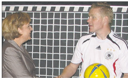
Mit Bundeskanzlerin a. D. Dr. Angela Merkel