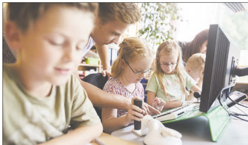
Junge Menschen für Schulbegleitung gesucht.

D ie Lebenshilfe Gelsenkirchen bietet auch in diesen turbulenten Zeiten jungen Menschen die Chance auf ein Freiwilliges Soziales Jahr (FSJ). Im Bereich der Schulbegleitung werden für den kommenden Sommer wieder junge Menschen gesucht, die erste Praxiserfahrungen sammeln möchten.