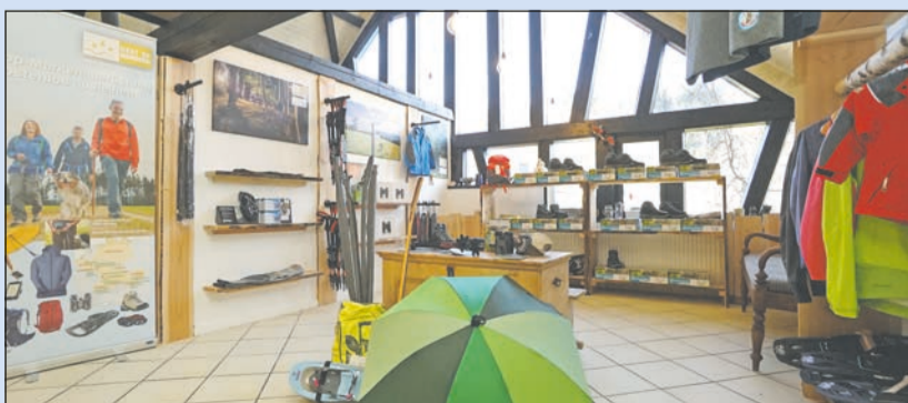
Neues Testcenter für Wanderer: Coole Ausrüstung kostenfrei ausleihen

Senden Sie uns eine E-Mail mit dem Betreff „Gewinnspiel Hunsrück Harfenmühle“ bis 27. Juli 2021 an gewinnspiel@lebenshilfe-nrw.de oder eine Karte/Brief per Post an Lebenshilfe NRW, Kennwort: „Gewinnspiel Hunsrück Harfenmühle“, Abtstraße 21, 50354 Hürth. vw