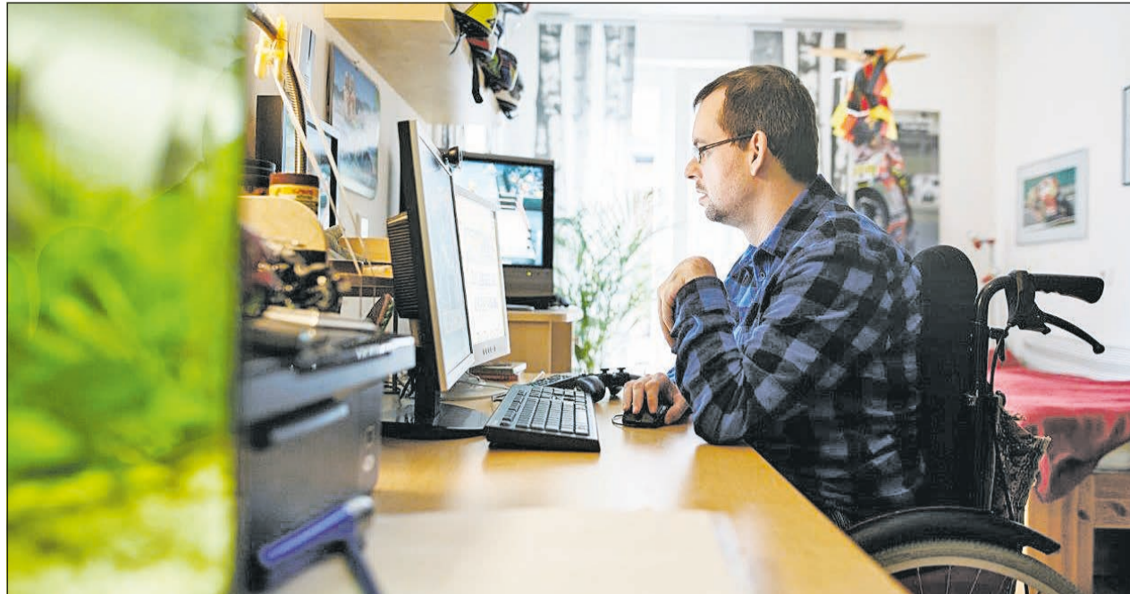
Glücklich über seinen neuen Arbeitsplatz (Symbolbild). Auch im Homeoffice wird unterstützt.