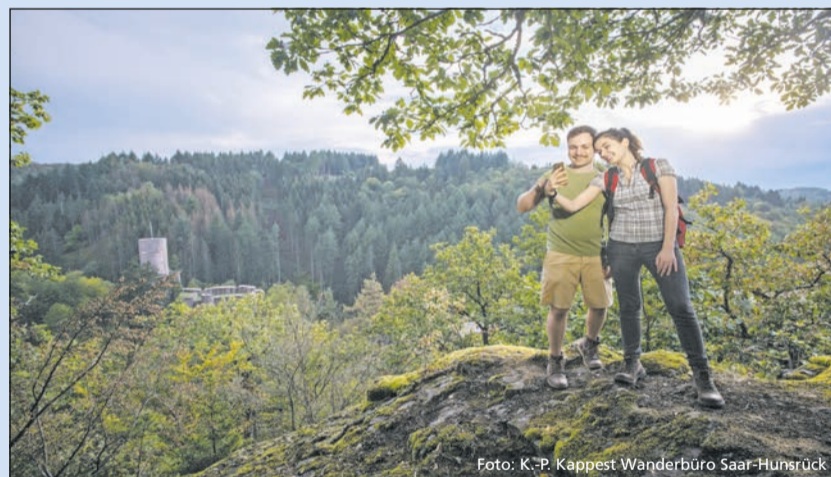
Erlebnisreiche Nationalparkregion Hunsrück-Hochwald

Überall säumt Moos den Wegesrand, schmale Pfade führen über Wurzeln und Felsblöcke,