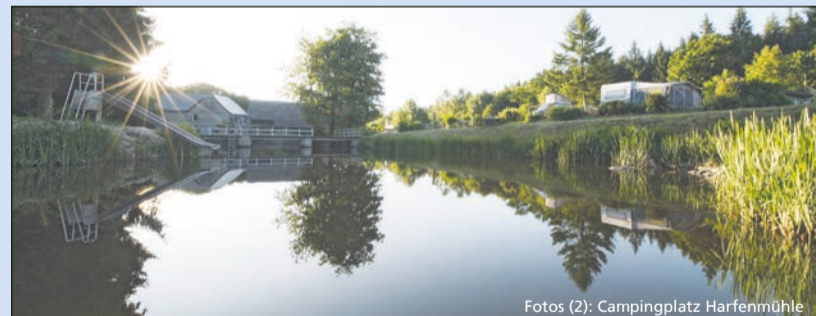
Idylle pur am See auf dem Campingplatz Harfenmühle

Gewinnen Sie einen Aufenthalt auf dem Fünf-Sterne-Campingplatz Harfenmühle: Vier Übernachtungen für die ganze Familie, gern inklusive Hund. Im Preis inbegriffen sind die Stellplatzgebühren für den eigenen Wohnwagen, Reisemobil oder Zelt sowie Strom. Exklusive sonstige Nebenkosten. Dazu gibt es eine geführte Wan-